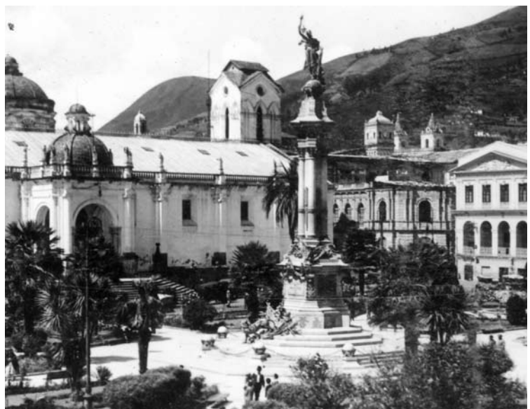
Figura 2: Monumento a la Independencia, 1809. Lorenzo y Francisco Durini. Mármol bronce.

3 Familia Durini. Comunicación verbal. 1999.