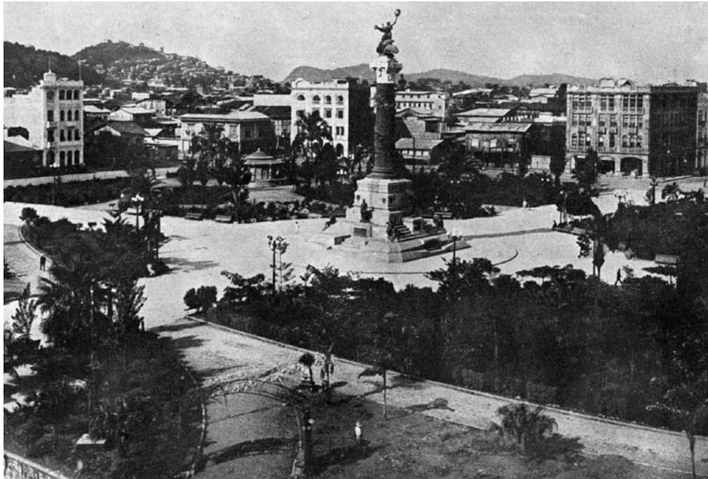
Figura 14: Eje y Plaza del Centenario.