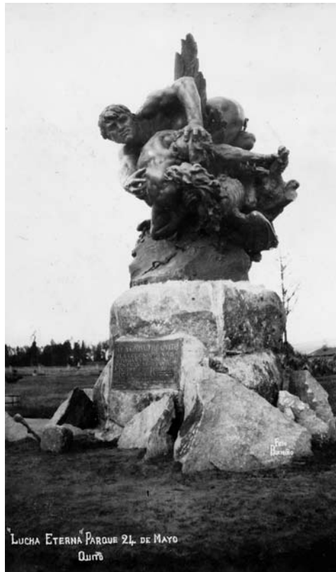
Figura 18: Monumento a la “Eterna Lucha”.