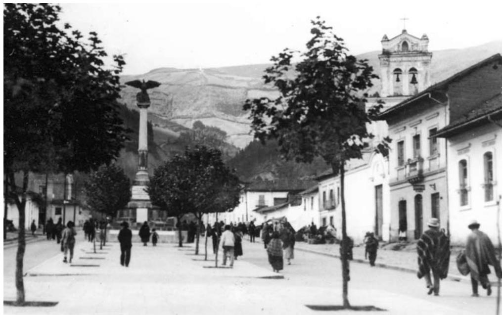
Figura 17: Avenida 24 de Mayo, al fondo se observa la columna dedicada a los Héroes Ignotos. Francisco Durini. Quito. 1922.

En 1920 el aspecto de las calles de la ciudad de Quito cambió significativamente con la adopción