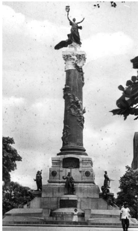
Figura 12: Héroes de la Independencia de Guayaquil.