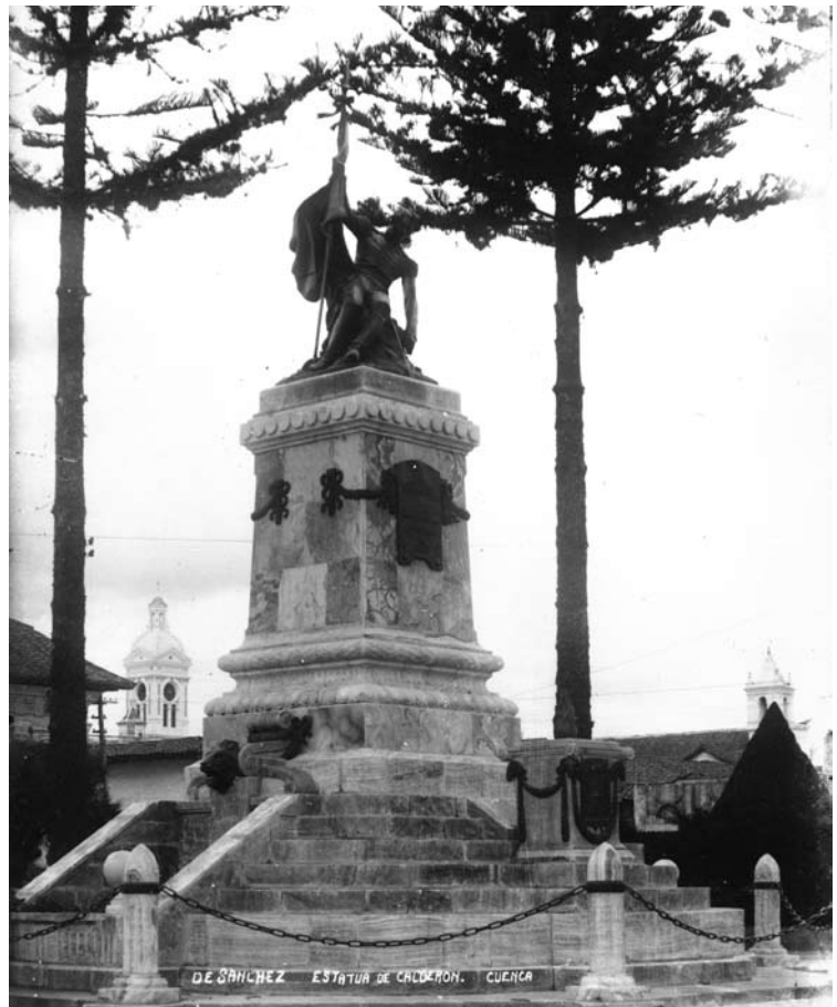
Figura 16: Monumento a Abdón Calderón, Cuenca.

Por su parte, la Dirección General de Correos adoptó este mapa, con una inscripción que dice: “Plano de Quito en el Centenario de la Batalla de Pichincha”, en escala 1:15.000. La inscripción del documento notifica a las sucursales de correo que desde esa fecha la repartición de co-