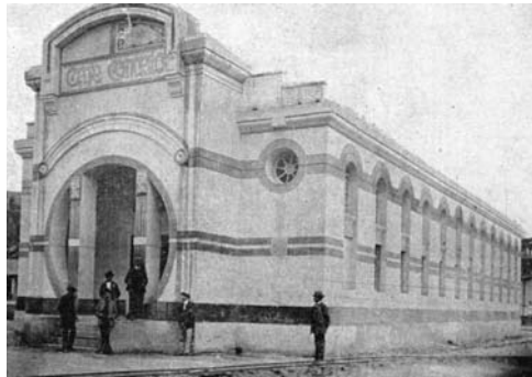
Figura 4: Pabellón de Estados Unidos para la exposición de 1909.

Fuente: El Ecuador, Guía Comercial, Agrícola e Industrial de la República (1909, p. 1247).