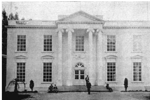
Figura 5: Edificio destinado a la Exposición del Centenario de 1909.