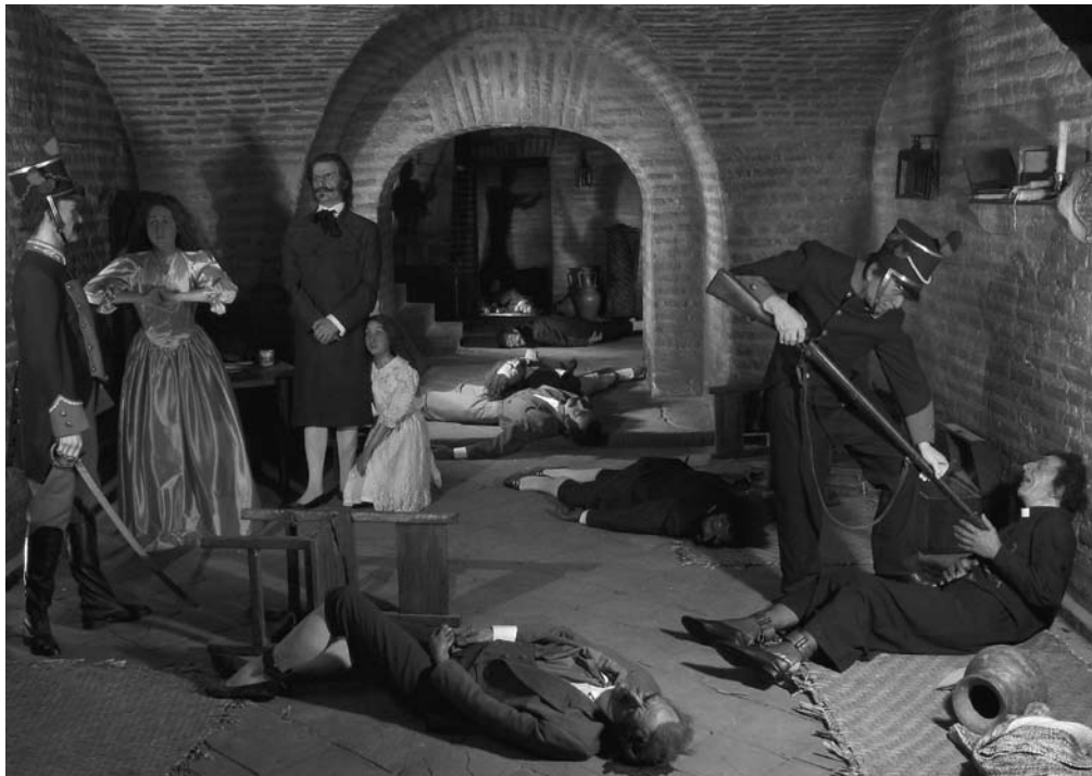
Figura 6: Escena de la matanza de los héroes del 2 de agosto de 1809.

Aunque no fue una obra prevista para esta celebración, años más tarde se adecuaron estas áreas para mostrar, con fines didácticos, la matanza de los héroes del 2 de agosto de 1809. En estas mazmorras permaneció apresado Eugenio Espejo, uno de los líderes intelectuales de la revolución. Esta imagen ha estado presente en la memoria de algunas generaciones de quiteños, pues era una visita obligada dentro de la formación escolar.