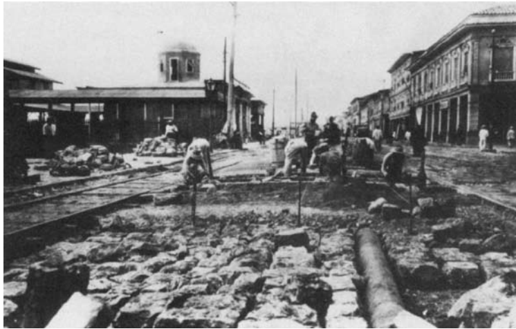
Figura 11: Trabajos de canalización y pavimentación realizados en el Malecón de Guayaquil.