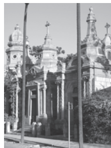
Cubierta: Cementerio General, Santiago, Chile.

Si desea suscribirse a la Revista Apuntes, hágalo a través de internet www.lalibreriadelau.com o por teléfono (57-1) 4839575 (57-1) 4837551