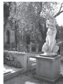
Portadilla Reseñas: Cementerio General, Santiago, Chile.