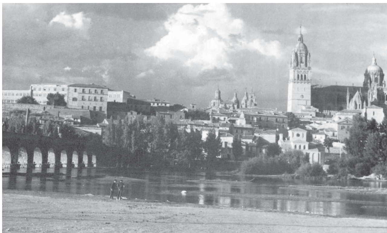
Las dos catedrales de Salamanca, ciudad natal de Antonio Fernández Alba.

Antonio Fernández Alba es uno de los arquitectos españoles más destacados de la segunda mitad del siglo XX. Son numerosas sus obras de arquitectura actual, con las cuales ha ganado un merecido prestigio internacional.