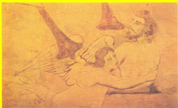
Rodolfo Vallín LAS PINTURAS MURALES DEL TEMPLO DE SANTO DOMINGO DE TUNJA