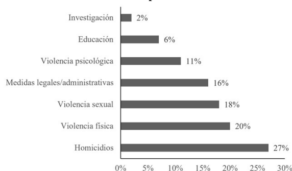
Figura 3 Temática abordada en las publicaciones

Por último, se llevó a cabo un análisis sobre los términos utilizados para hacer referencia al fenómeno de la violencia de género, tal como