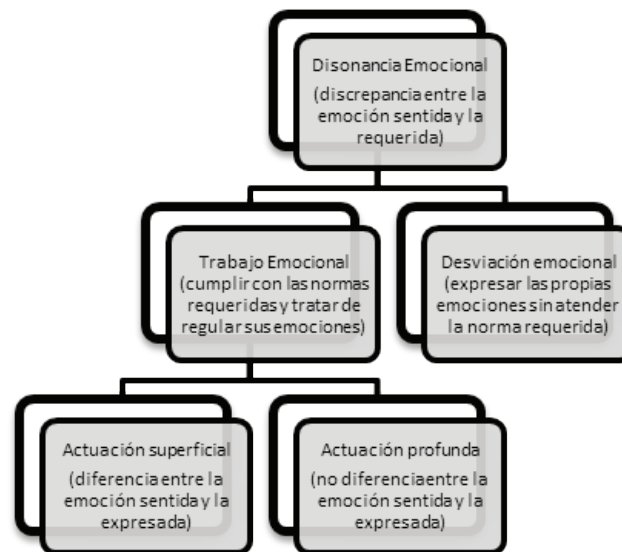
Figura 1. El proceso del trabajo emocional.

También la Teoría de los Eventos Afectivos (Weiss & Cropanzano, 1996) puede explicar este proceso psicosocial. Dicha teoría afirma que los acontecimientos afectivos en el trabajo pueden ayudar a explicar las actitudes y comportamientos de los trabajadores. De este modo, si un evento