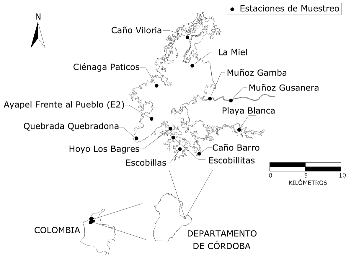
Figura 1. Ubicación de la Ciénaga de Ayapel y de las estaciones de muestreo.