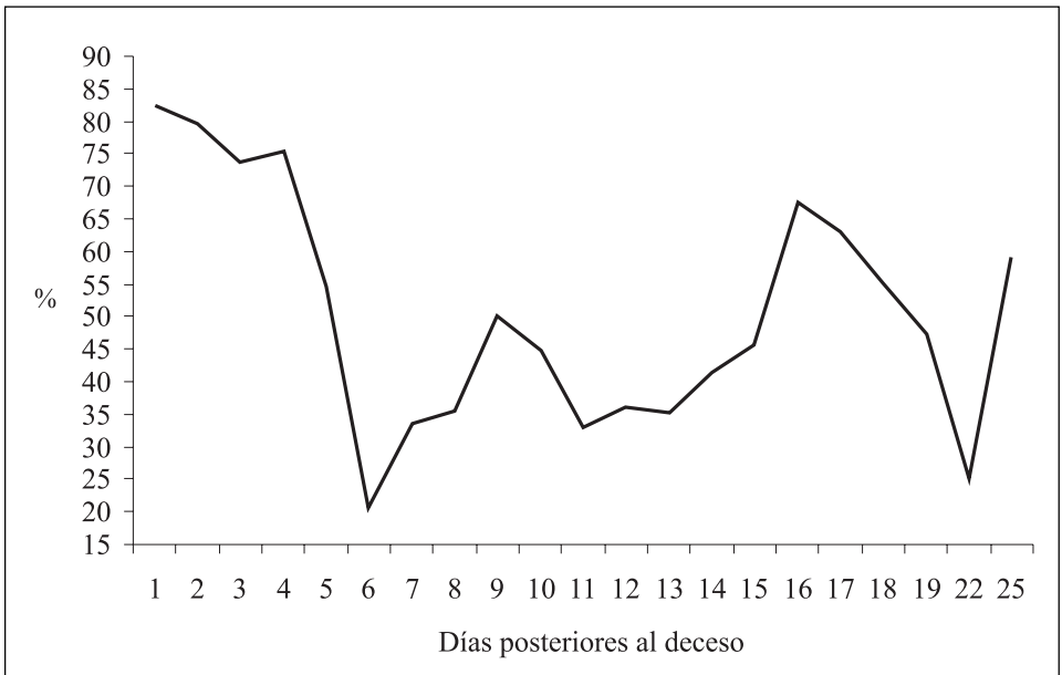
Figura 2. Humedad relativa ambiental durante los meses de julio y agosto.