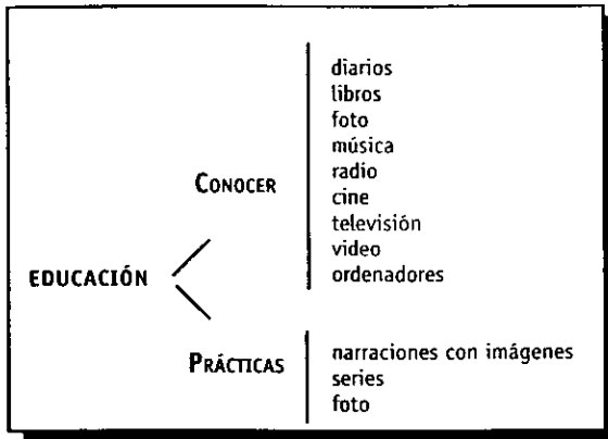
FIGURA 3. EDUCACIÓN CON Y PARA LOS MEDIOS

Para evitar esta distorsión, es importante que la formación en medios de comunicación sea impartida como una parte más de la educación que requiere la compleja sociedad actual. No se puede hablar de educación integral, si no se concibe como objetivo de la enseñanza básica en todos sus niveles, la educación en la lectura crítica de los medios de comunicación.