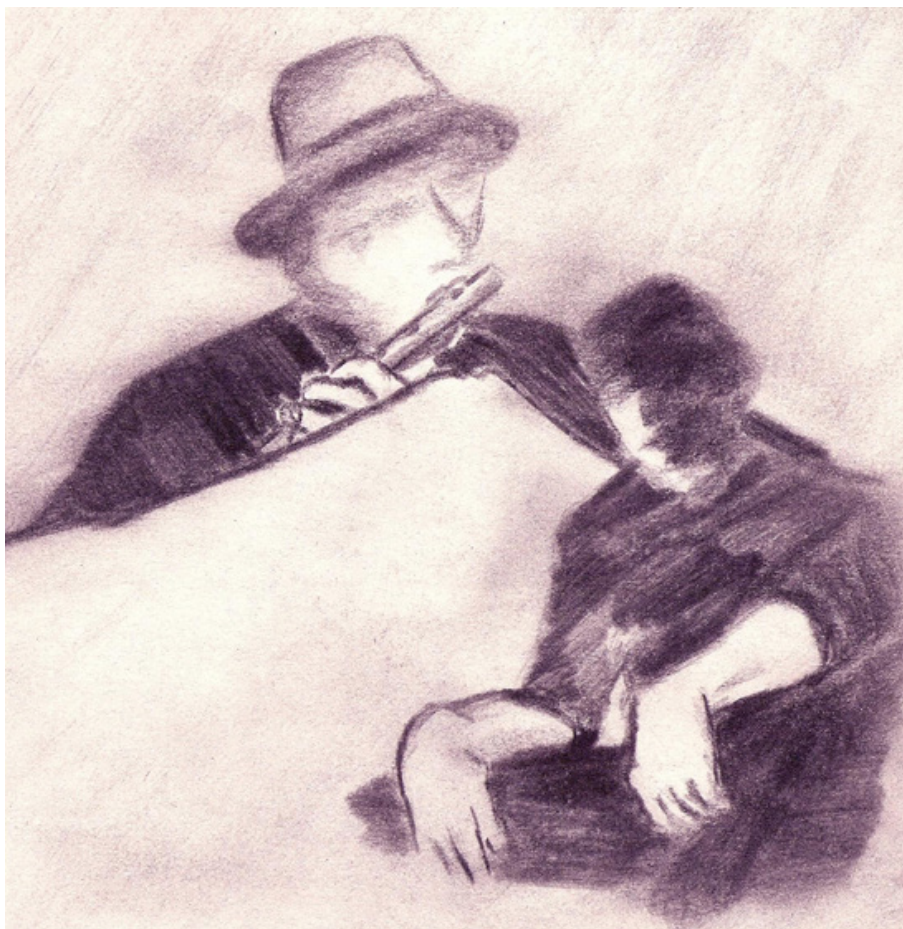
Figura 3. Los Mayores. Dibujo a carboncillo sobre papel bond de Franco Ceballos Rosero, 2006

nadie. Bueno, me la contó mi abuelo, pero él me advirtió que sólo la entendería cuando la soñara, así que te cuento la historia que soñé y no la que me contó mi abuelo” (Marcos, 1995).