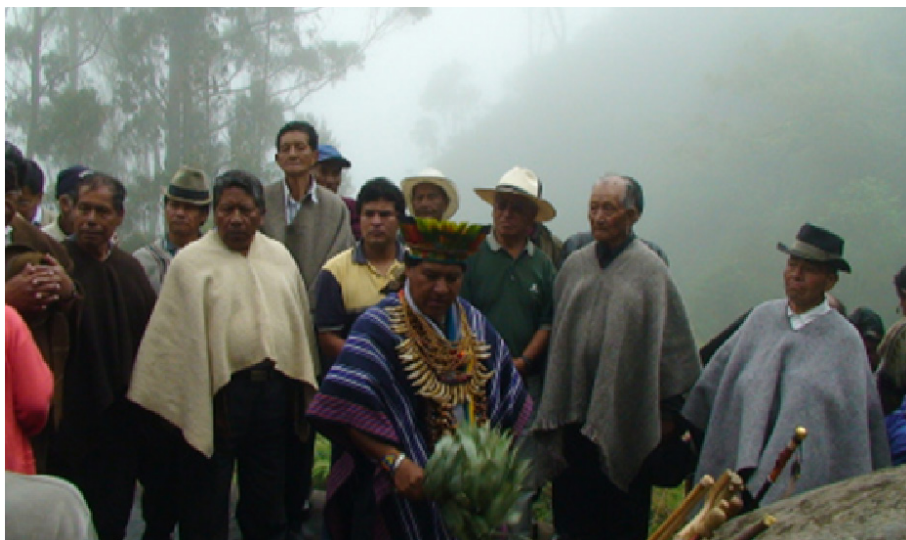
Figura 1. La posesión del Cabildo de Jenoy en 2008